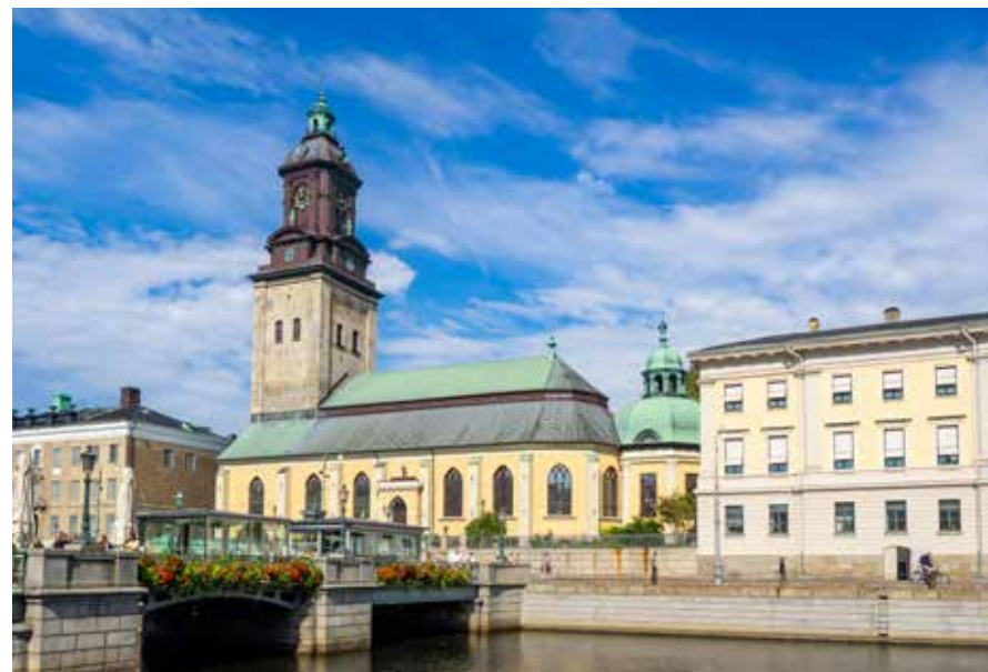
Tyska Christinae kyrka ligger mitt i Göteborgs Stads historiska centrum och är den tredje stenkyrkan på samma plats. De två första förstördes helt eller delvis i två förödande stadsbränder. Den nuvarande kyrkan stod klar 1783 och beskrevs av sin samtid som ett av stadens mest imponerande byggnadsverk.

Jubileumsvåren 2023 planeras konsertserien "Från barock till pop" – fem konserter som tillsammans speglar kyrkans betydelse för Göteborgs musikliv från 1600-talet till i dag. Varje århundrade ges musikalisk gestalt i en kyrka, med 1600-talskonsert i Tyska Christinae kyrka, 1700-tal i Hagakyrkan, 1800-tal i Domkyrkan, 1900-tal i Johannebergskyrkan och 2000-talskonsert i Annedalskyrkan. Kyrkans betydelse för livemusiken berättar vi också mer om i föreläsningen "Musiken i staden under 400 år".